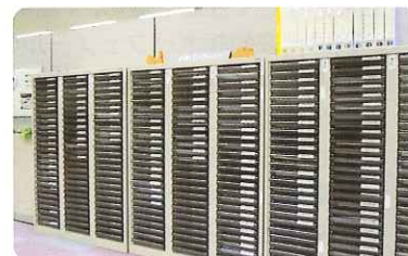
企業パンフレットコーナー