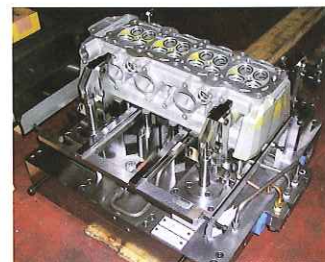
各種精密部品加工用治具の 設計製作