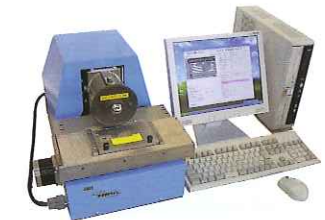
刻印トレーサビリティシステム