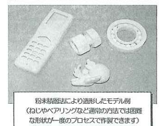
粉末積層法により造形したモデル例 (なじやベアリングなど通常の手法では困難な形状が一度のプロセスで作製できます)