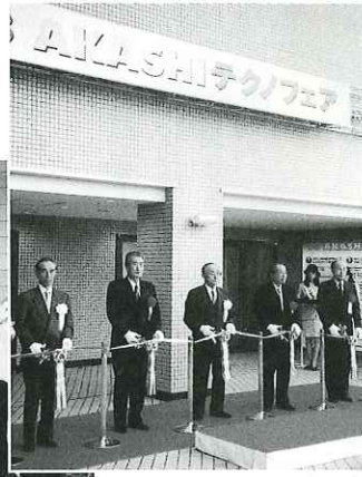
▲オープニング式典