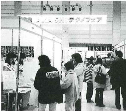
▼市民でにぎわう会場風景

ず、市内企業を中心としてテクノロジ、マルチメディア、物産など幅広い分野から38企業・研究機関の出展がありました。